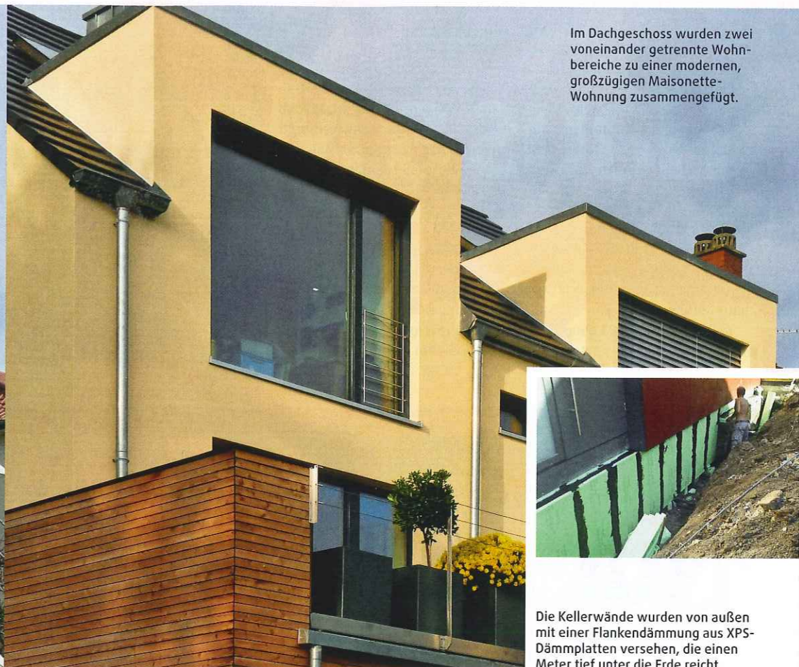
Im Dachgeschoss wurden zwei voneinander getrennte Wohnbereiche zu einer modernen, großzügigen Maisonette-Wohnung zusammengefügt.