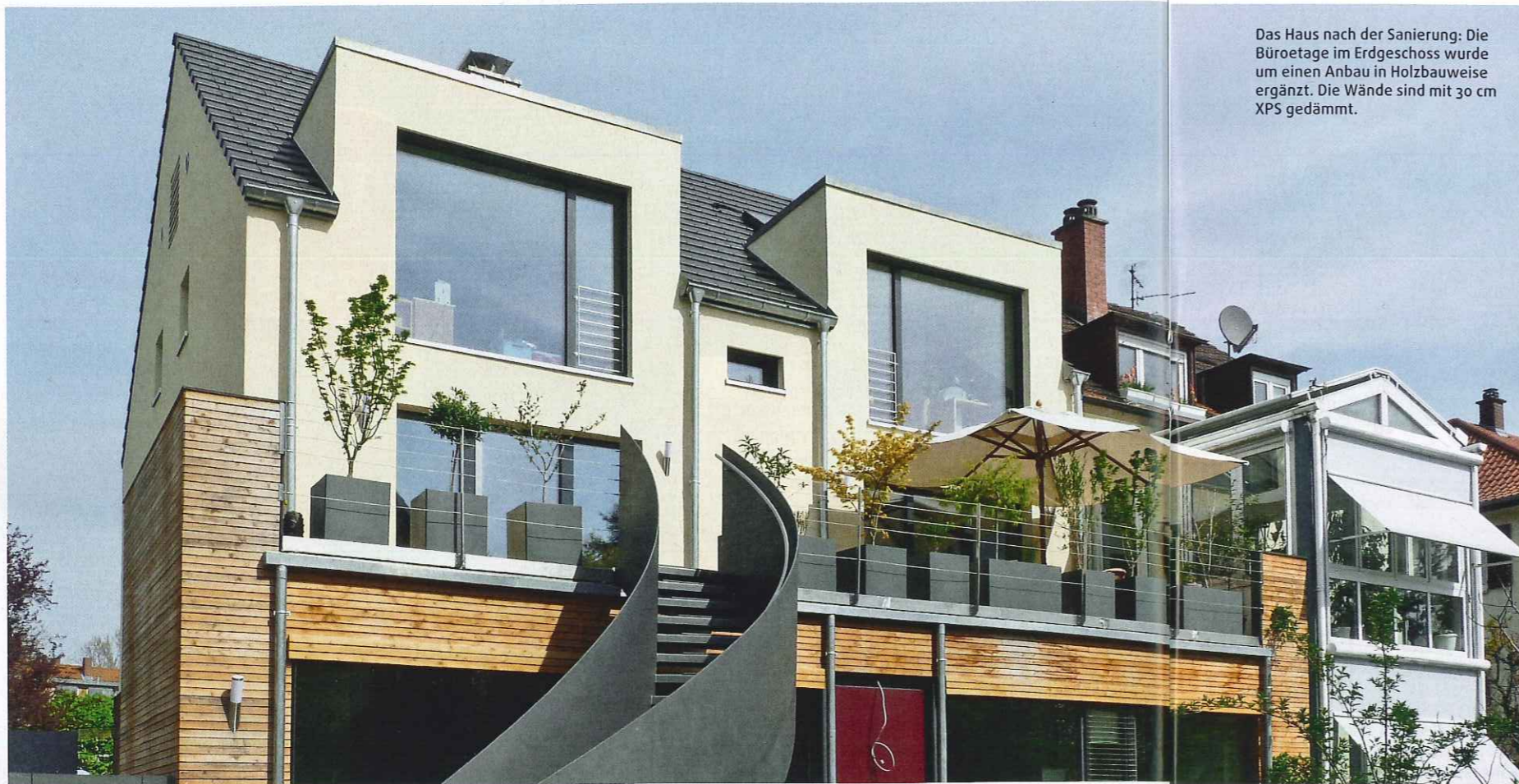
Das Haus nach der Sanierung: Die Büroetage im Erdgeschoss wurde um einen Anbau in Holzbauweise ergänzt. Die Wände sind mit 30 cm XPS gedämmt.