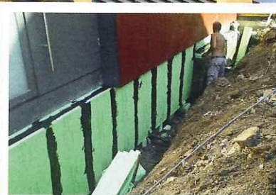
Die Kellerwände wurden von außen mit einer Flankendämmung aus XPS-Dämmplatten versehen, die einen Meter tief unter die Erde reicht.